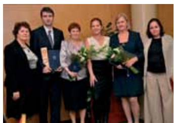
GAZDAGRÉT KITÜNTETTHEJVEL 2013-BAN