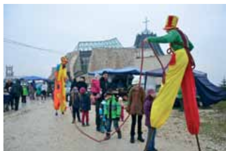
FARSANGI MULATSÁG A PIACON