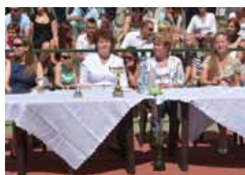
ÉVZÁRÓ A TÖRÖKUGRATÓ ISKOLÁBÁN