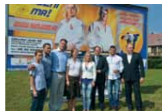
FELHÍVÁS: KEZD EL JUDOZNI MA!