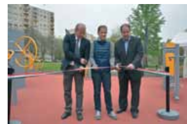
FITNESS PARK ÁTADÓJA