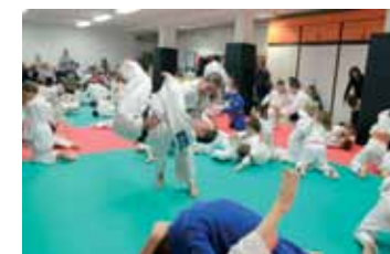
JUDO AKADÉMIA A CSÍKIHEGYEK ISKOLÁBÁN