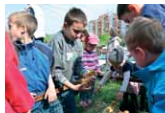
HÚSVÉTI ÁLLATSIMOGATÓ A PIACON