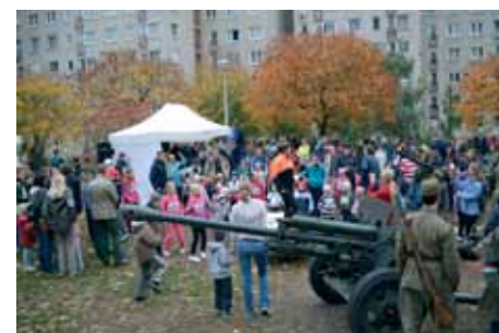
OKTÓBER 23-I FUTÓVERSENY