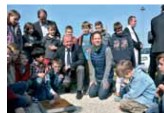
TANUSZODA ÉPÜL GAZDAGRÉTEŰN