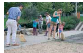
TAKARÍTÁS A DZSUNGELÉS JÁTSZÓTÉREŰN