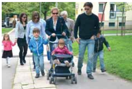
CSALÁDI KÖRBEŰN GAZDAGRÉTEŰN