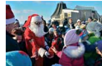
MIKULÁS A PIACON