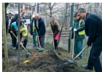
FAÜLTETÉS A CSÍKIHEGYEK ISKOLÁBÁN