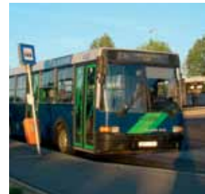
MARAD A 239-ES BUSZ