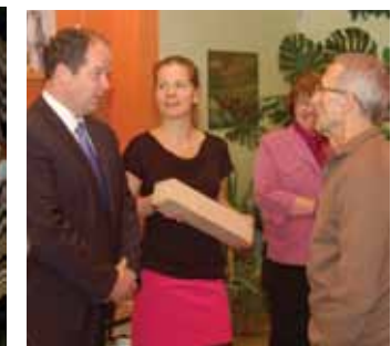
ÚJBUDA KIVÁLÓ EDZŐJE