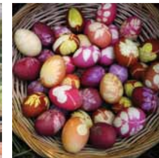
C SINÁLD MAGAD- TOJÁSFESTÉS