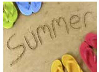
GYEREKEKET KÉRDEZ- TÜNK A NYÁRRÓL